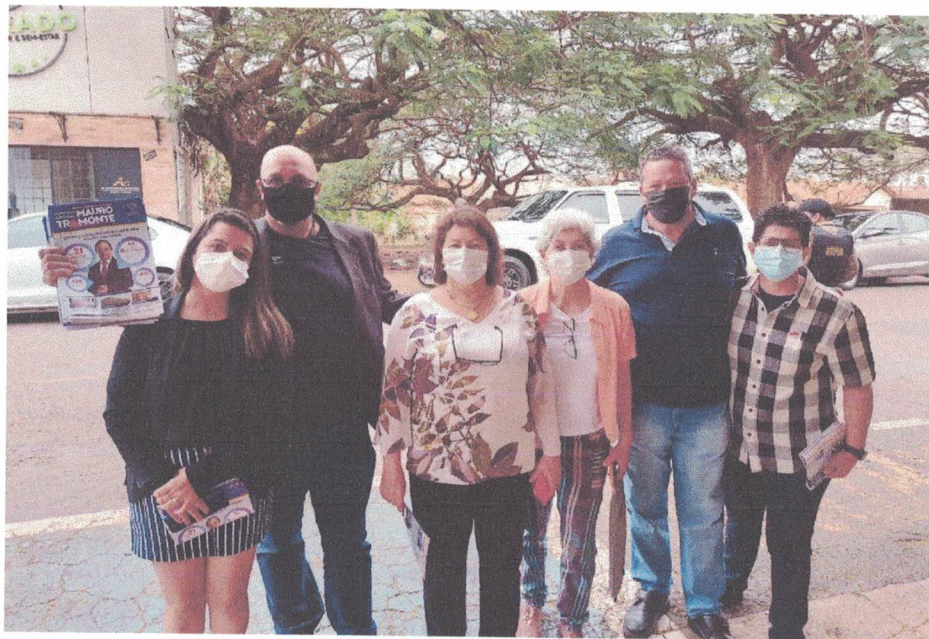
Figura 1 - Reunião em Alfenas-MG